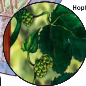
Hopfendolde im Sommer