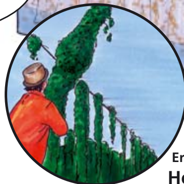
Ernte im Herbst

Mit seinen Klimmhaaren hält sich der Hopfen an allem fest was er findet.